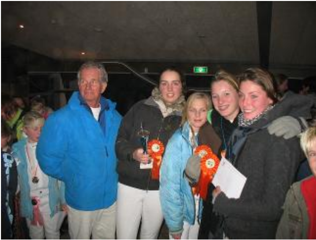
equipe biggen en wolf