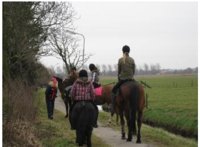
Vossenjacht op zondag 15 februari