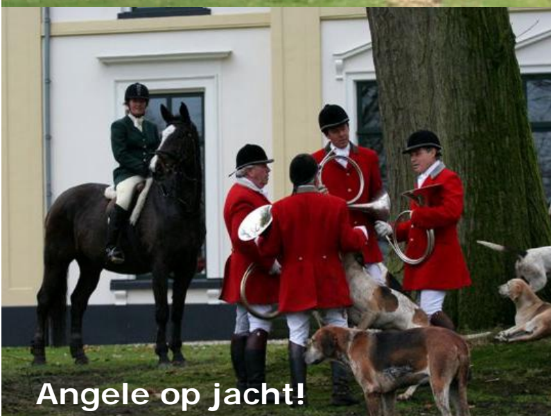
Angele op jacht!