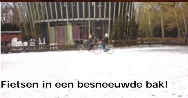
Fietsen in een besneeuwde bak!