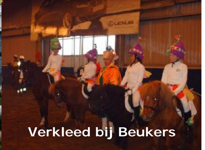
Verkleed bij Beukers