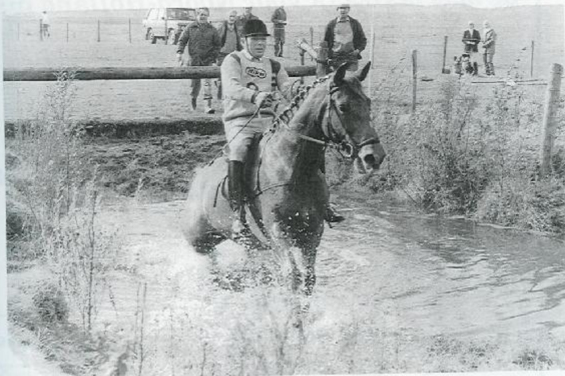
Foto: deelname onderdeel cross Egmond, 3-10-1984.